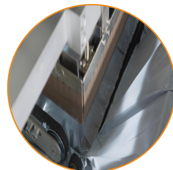
自动打印面单打包